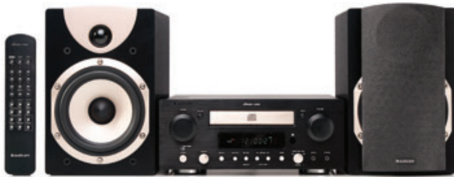
BLACK CHAMPAGNE EDITION

Stereo One is available in two models, each with the same high quality and exclusive finish. The front panel is made of 6-mm [ <1/4 inch] thick, solid aluminum, and the knobs are hand-turned in the same material. These features give Stereo One a highly mechanical feel that radiates "high-end stereo product." The system is compact, but the sound is big enough to fill even a large living room.